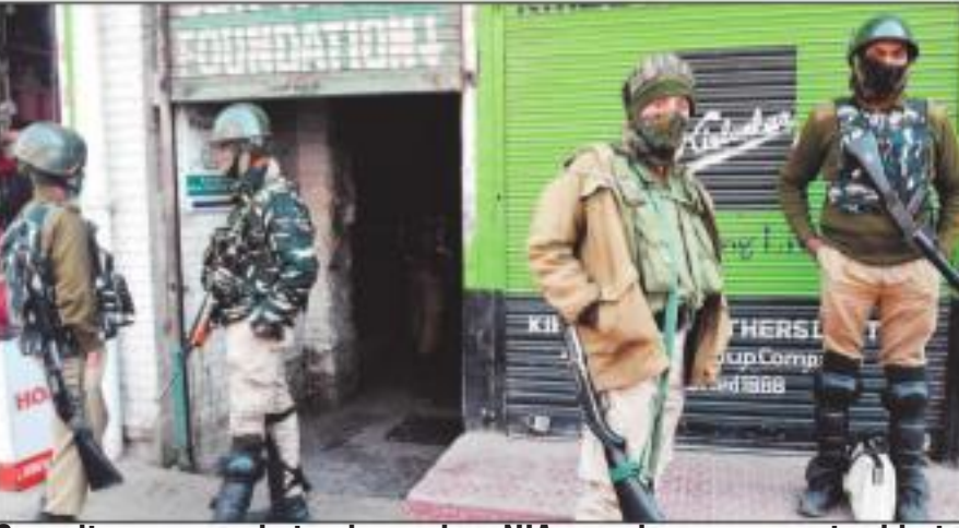
Security personnel stand guard as NIA members carry out raid at the Greater Kashmir office, in Srinagar on Thursday.