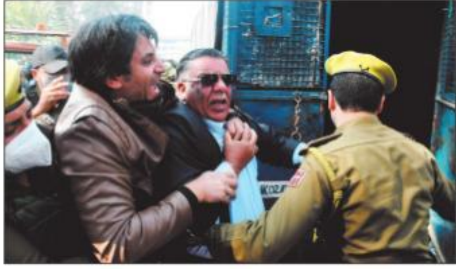
Police personnel detain PDP leaders during a protest against the recent notification of land laws outside PDP office, in Srinagar.